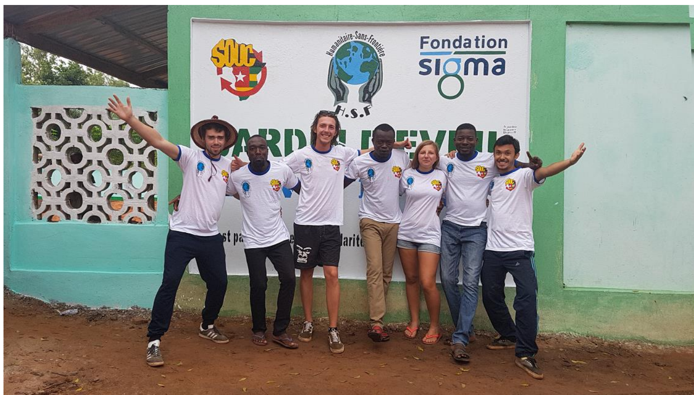
Les membres de l'équipe du SOUC et de HSF-Togo ayant participé au camp chantier devant le mur du centre d'éveil de Vo-Kponou.

Le SOUC (Solidarité internationale des étudiants de Clermont) est une association de l'école d'ingénieur SIGMA-Clermont à but humanitaire, les adhérents sont donc les étudiants de cette école. Depuis 2012, le SOUC œuvre en partenariat avec l'association HSF-Togo sur différents projets. Le but étant d'envoyer deux semaines, chaque année, quelques adhérents du SOUC poursuivre le projet commencé, dans le petit village côtier Vo-Kponou à 50km de Lomé, la capitale.